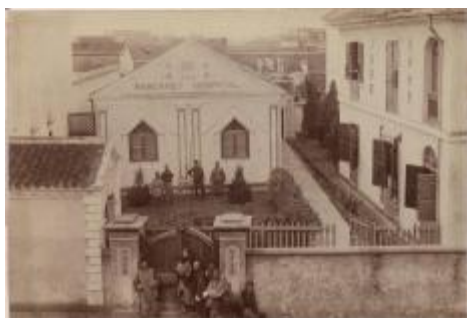
清末民初玛格丽特纪念医院外景 Margaret Hospital Wuhan

随着百姓对于西医的不断认同和了解, 仁济医院的扩展相当顺利, 1873年、1875年、1887年、