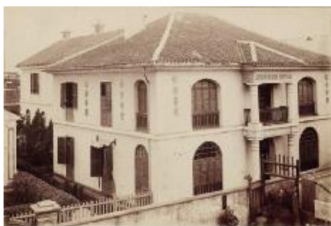
清末民初汉口仁济医院外景 London Mission Hospital

现在的江汉路四明银行旧址一带, 就是当年汉口仁济医院最初创立的地方。这也是武汉协和医院一百五十年来发展的原点。“物有本末, 事有终始。”任何事情总有个源头, 有个起点, 武汉协和医院一百五十年宏图大展, 起始点不过是汉口的一条小巷, 毗邻英国租界, 名字叫作“居巷”。