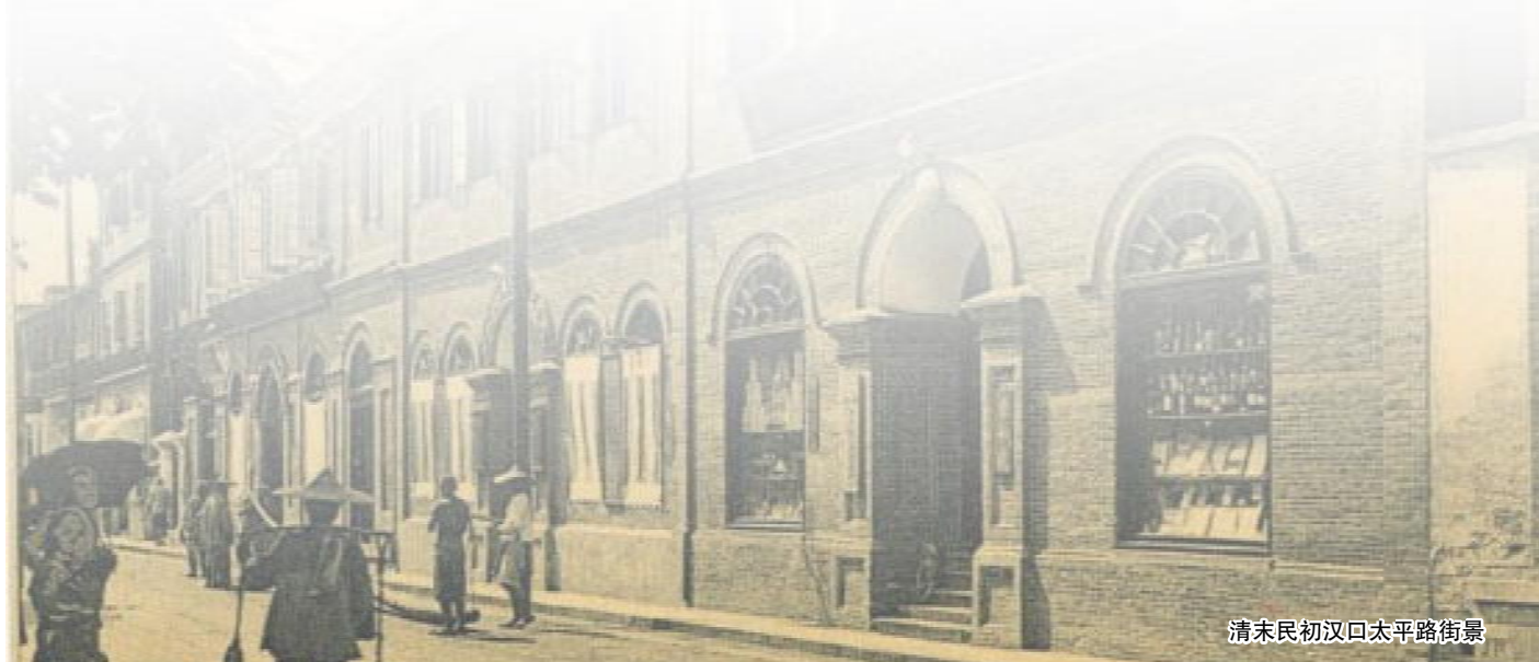
清末民初汉口太平路街景

1882年, 英国伦敦会总部派外科医生纪立生来汉, 仁济医院首次开设外科, 开始了普通手术和截肢手术。1906年, 大同医学院首批毕业生进入仁济, 医院开始有了华人医生, “后来医务发达, 每年两三万号, 门诊两三千。”接下来的故事, 现在的医院管理者应当很好理解, 业务扩张, 地皮限制, 多次搬迁扩建, 始终不能解决根本问题, 怎么办? 寻新址, 建新院。不想天上掉馅饼, 大家找到西满路(后称中正路, 中正大道, 现解放大道)心仪的地块, 地主居然一文不取, 拱手相让, 最初13亩多, 后扩大到30亩, 新医院的设计和建设由此启动。伦敦会、循道会, 一起出钱, 共襄盛举, 1926年开始, 边建边搬, 先搬女部再搬男部, 直至1928年全部竣工, 4月4日举行辟门典礼, 正式宣告成立——是为汉口协和医院。(薛宣)